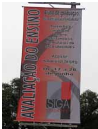
Painel de divulgação no campus "Luiz de Queiroz"

A ferramenta SIGA-UNIDADES foi desenvolvida para que as Unidades da USP possam aplicar avaliações de disciplinas e docentes aos alunos de graduação.