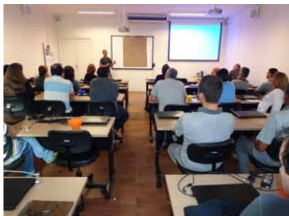
Sala de Treinamento/CPDigi - Palestra “Moradias Sustentáveis”