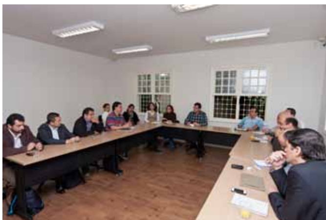
Sala de Reuniões/CPDigi - Assinatura da Ata de Registro de Preço

Ltda ME EPP, M&E Assistência Técnica e Informática ME e Engemon Comércio e Serviços Técnicos Ltda..