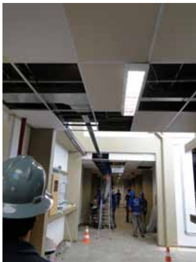
Obras no Departamento de Ciências Florestais