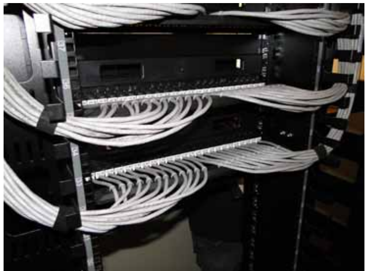
Novo Rack de Telecom com cabeamento estruturado do Departamento de Ciências Florestais