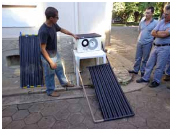
Oficina de construção de aquecedor solar de água com tecnologia sustentável